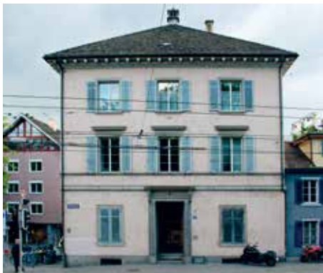
Ehemaliger Hauptsitz der Pro Juventute

Jenischenverfolgung durch die Pro Juventute, Kantonsbehörden und andere Kindswegnahme-Organisationen wie die Seraphischen Liebeswerke. Einige wenige Kantone überwinden sich nun dazu, den fahrenden Jenischen – die Mehrheit lebt aber sesshaft – genügend Plätze zur Verfügung zu stellen. Viele andere Kantone haben das aber, trotz der dazu 1996 geschaffenen «Stiftung Zukunft für Schweizer Fahrende», bis heute nicht geschafft, wovon in den letzten Jahren zahlreiche Besetzungsaktionen zeugten.