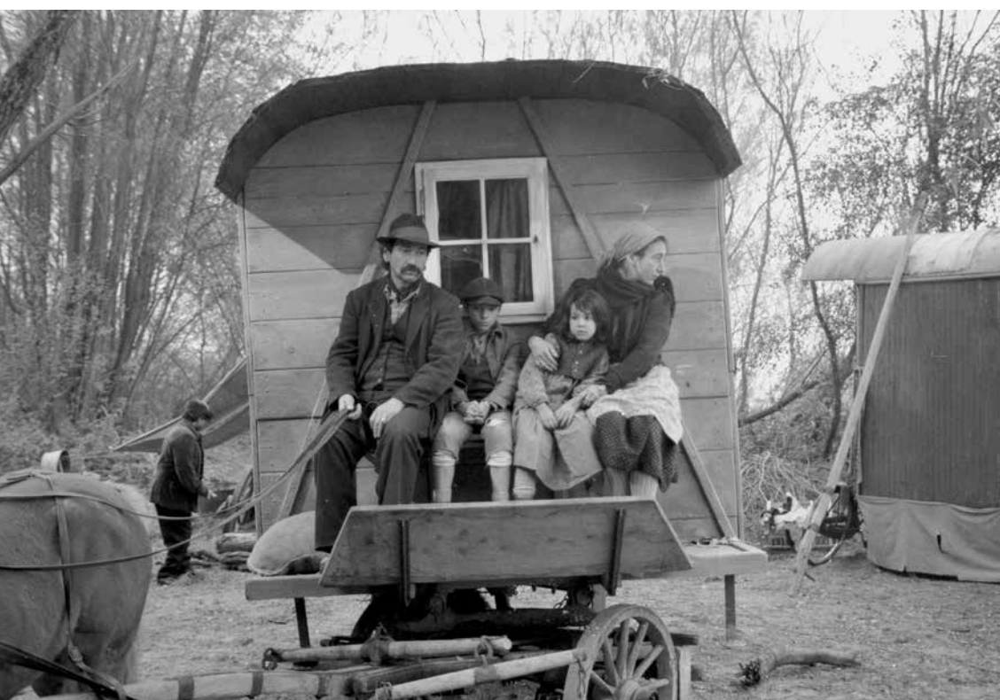
Standfoto Film Kinder der Landstrasse von Urs Egger 1992

Es folgte die Aktenübergabe ans Bundesarchiv und ein Prozedere zur teilweisen Akteneinsicht, wobei eine Aktenkommission Einschwätzungen vornahm. Zwei Fondskommissionen verteilten ab 1988 sehr tief angesetzte «Wiedergutmachtungszahlungen» an die getrennt aufgewachsenen, in Anstalten misshandelten und in einigen Fällen auch zwangssterilisierten Opfer der